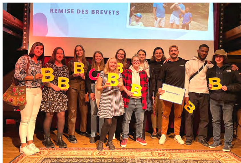
youngcaritas bei der Verleihung des Zeugnis durch das Ministerium für Bildung, Kinder und Jugend im Melusina

24 Anwärter haben am Brevet A, 19 am Brevet B, 2 am Brevet E, 3 am Brevet F und 7 am Zusatzwochenende teilgenommen. Bei den Ausbildungswochenenden waren 9 junge Trainer im Einsatz. Zusätzlich zu den Brevets haben 27 Teilnehmer am Fahrsicherheitstraining des CFC teilgenommen.