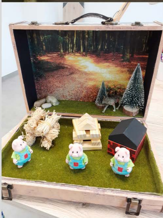
Un exemple de boîte à histoires avec le conte des trois petits cochons

Sur ce, l'année 2022 a été riche en nouveautés et développement et je souhaite au moins la même chose pour l'année 2023.