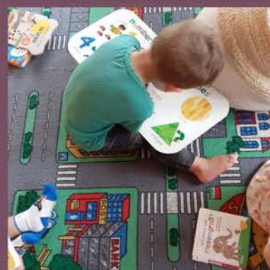
"Kuck an entdeck"