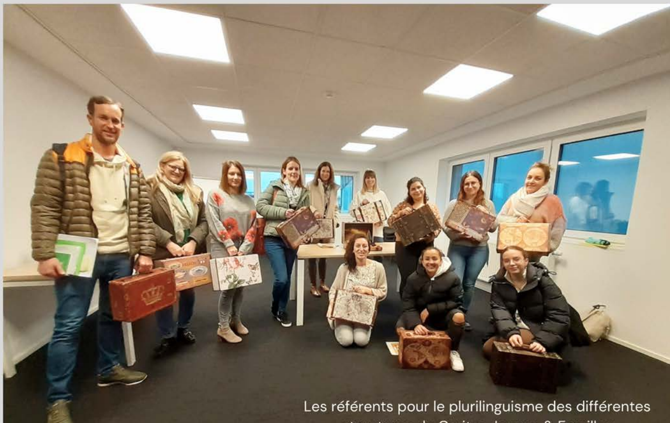
Les référents pour le plurilinguisme des différentes structures de Caritas Jeunes & Familles