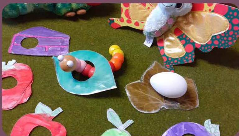
sac à histoires