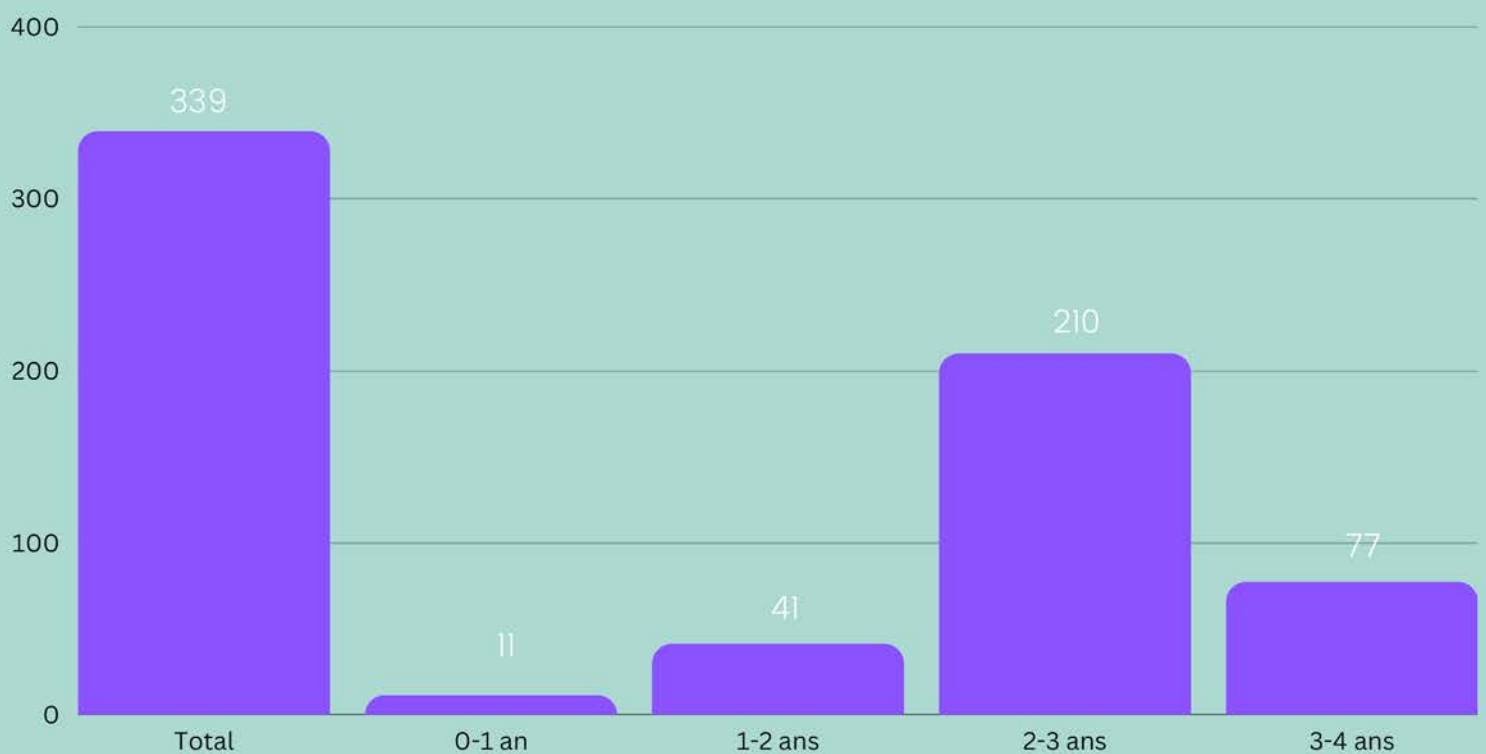
Total des enfants et par âge

Au total 339 enfants ont pu profiter des activités organisées en collaboration avec le Bibliobus. Identique à l'année précédente, la tranche d'âge des deux à trois ans est celle avec la plus grande partie de participants. La tranche d'âge des plus âgés est, par contre, nettement moins élevée qu'en 2021.